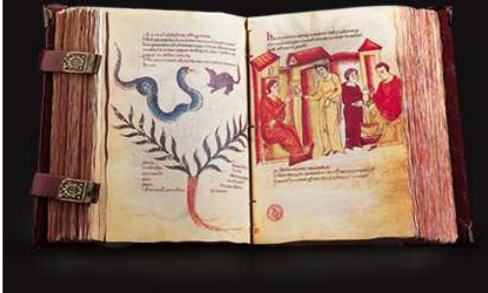
Códice sobre Medicamentos de Federico II, s.XIII