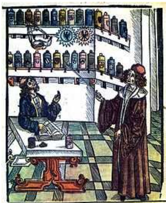
Doctor y Boticario, s.XVI

En la prueba práctica se exige saber componer las fórmulas de los medicamentos simples--material cualquiera de procedencia orgánica o inorgánica, que sirve por sí solo a la medicina, o que entra en la composición de un medicamento- , Mateo Plateario, Médico, s.XI/XII) - y compuestos, así como saber seleccionar, preparar y conservar las yerbas.