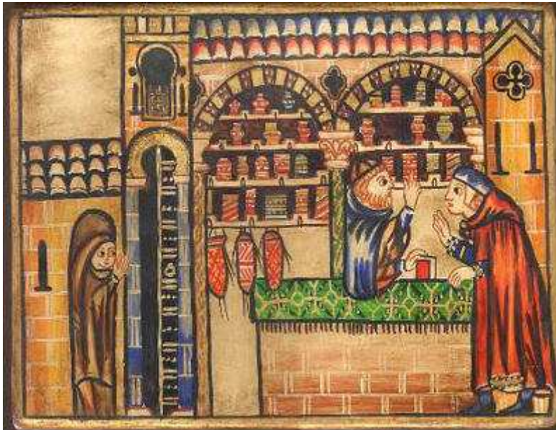
Boticario Judío, Cantigas, s.XIII

A comienzos de la Edad Media encuentran los judíos las primeras nociones referentes a las plantas medicinales dispersas en los distintos tratados Talmúdicos