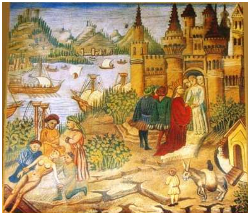
Universidad de Salerno S. XII

Para no perjudicar indebidamente su Oficio, las Boticas deberán guardar determinadas distancias entre sí, teniendo como criterio el número de habitantes de la villa o ciudad.