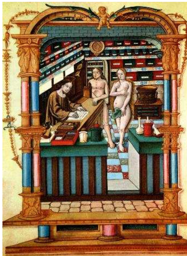
Cristo como Boticario de Adán y Eva