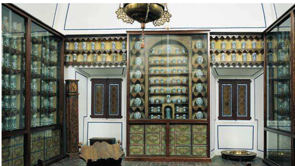
Botica del Monasterio de Silos

Recibí de mis Derechos seis rs. de vellón, no más, doy fe.