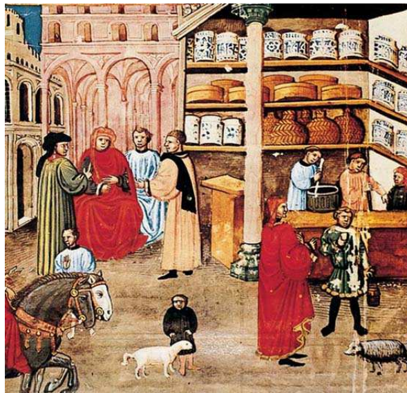
Miniatura de un Manuscrito de Avicena, s.XV

Los Visitadores inspeccionan los purgantes ,gomas, enjundias, electuarios, píldoras, aceites, jarabes ,emulsiones(pomadas, cremas),aguas destiladas, etc.; así como los precios ,pesos, estado de los medicamentos y recipientes, existencia de los libros de formularios y el utillaje de la Botica como son el Alambique o Destilador : aparato que, por destilación, permite separar, mediante calor, las sustancias volátiles de las que no lo son o carecen de esta posibilidad; la Espátula : útil para mezclar sustancias sólidas; el Granatario : pequeña balanza que sirve para pesar y medir sustancias sólidas; el Molino : aparato por el que se procede al triturado y mezclado de sustancias sólidas precisas para hacer pomadas ;la Prensa : mecanismo que posibilita obtener jugos utilizados en la edulcoración de jarabes ;El Armario o Separanda : mueble donde se custodian las sustancias que deben estar separadas del resto, tales como venenos; el Cordialero : ámbito donde se coloca la frasquería ; Mortero : que, en forma de cuenco, sirve para machacar.