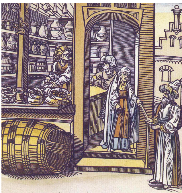
El Salón del Alquimista

Las primeras Agrupaciones de Boticarios tuvieron lugar en nuestro país en el s. XIV, seguramente fue la unión de especieros, herboristas y apotecarios , a la usanza de los Collegia romanos, conformándose como Asociaciones Cofradías que, con el tiempo, darán lugar a los Colegios de Boticarios .