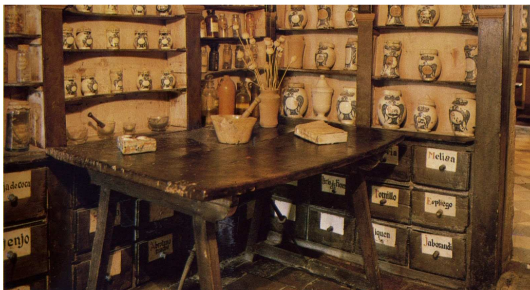
Botica de Uceda, s.XVI