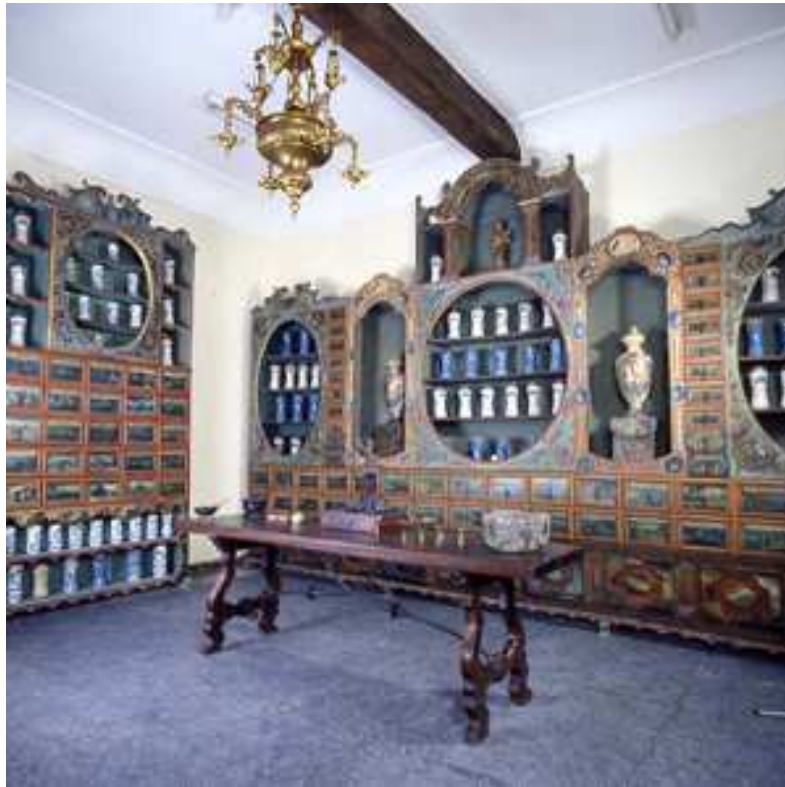
Botica del Hospital de San Juan de Astorga, s.XVIII