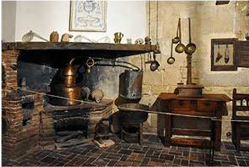
Alambique del Monasterio de Silos