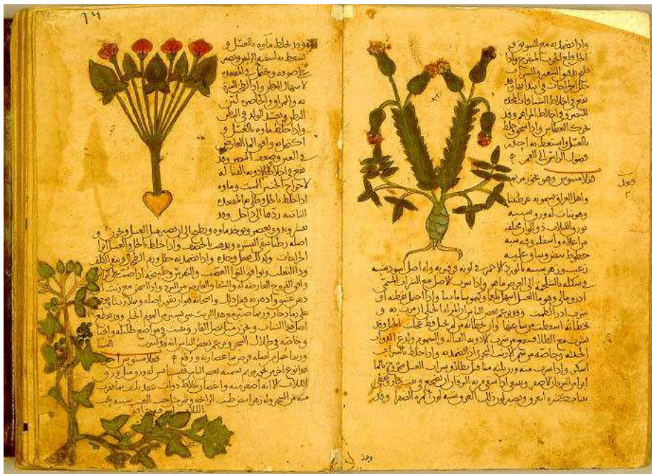
Códice de Dioscórides