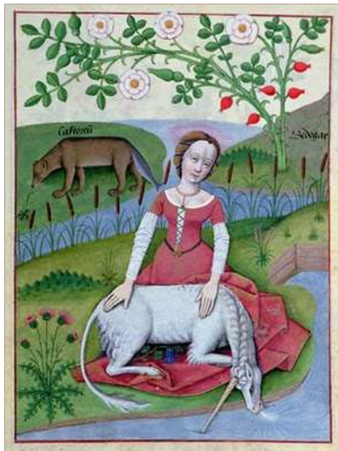
La Dama y el Unicornio, s.XV

4 onzas Mercurio Dulce ,16 rs. 1 libra 2 onzas Licor Anodino ,45 rs. 9 onzas Agua Epidémica ,5 rs. 12 onzas, Agua Balnearia ,12 rs. 12 onzas, Agua Vital Mulierum ,12 rs. 12 onzas Agua Apoplética ,12 rs. 12 onzas Agua Imperial ,12 rs. 12 onzas Agua Teriacal Espirituosa ,20 rs. 12 onzas Agua Antiepiléptica ,12 rs. 12 onzas Agua Brionia Compuesta , 12 rs, 12 onzas Éter Aséptico ,120 rs. 6 onzas Sal Policresta ,6 rs, 1 libra 4 onzas, Elixir de Vitriolo Dulce ,40 rs. 10 onzas Éter Sulfúrico ,30 rs. 2 libras Agua Fuerte ,20 rs. 4 onzas, Ácido Nítrico ,10 rs. 1 onza Espíritu de Sal Dulce ,2 rs. 1 libra Óxido de Hierro Negro ,10 rs