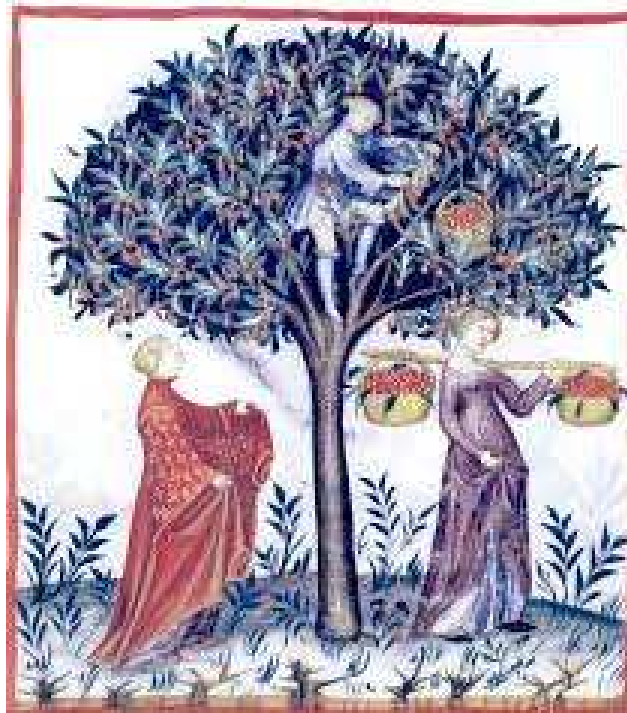
Tacuinum Sanitatis de Cerruti, s.XIV