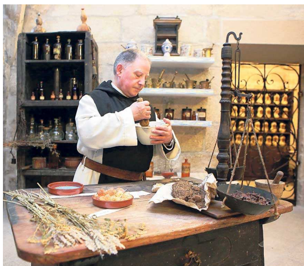
Botica del Monje del Monasterio de Oseira

Es en el s.XVIII, los profesionales de la Botica se muestran no sólo como Maestros Boticarios , título otorgado por el Real Protomedicato , sino como profesionales debidamente cualificados por su carácter Académico , con estudios de Bachiller en Artes , como preparación previa, y por el Bachiller en Química , así como otros dos años de práctica en una Botica , “dejando de ser un machacante para mudarse en un profesional de la sanidad”.