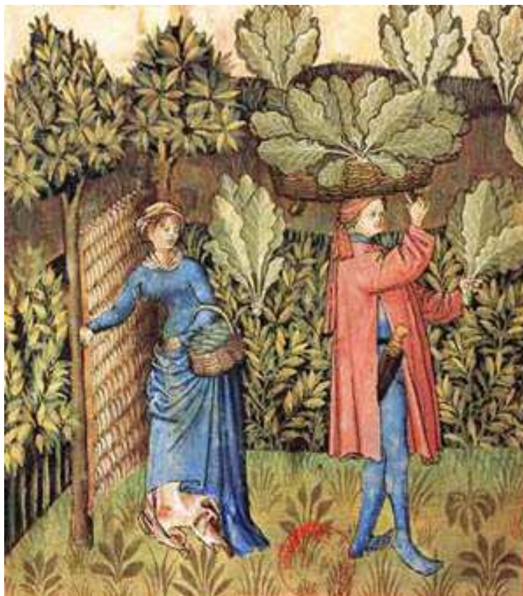
Tacuinum Sanitatis, Avicena, s.XV