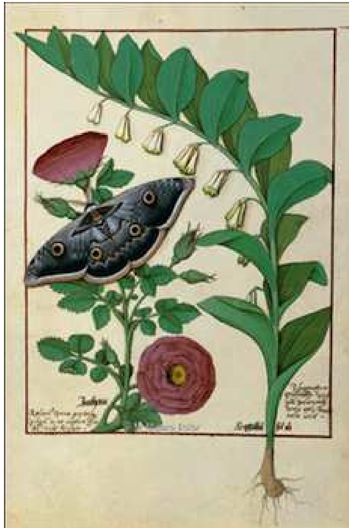
Libro de las Medicinas Sencillas, s.XV

1 libra Sanguinaria , 2 rs, 4 libras, Raíz de Peonía , 8 rs. 2 libras Árnica , 10 rs. 1 libra de Flor de Sauce , 2 rs. 1 libra Escordio , 4 rs, 2 libra Romero , 4 rs, 1 libra de Hiedra Terrestre , 3 rs. 2 libras de Salvia Silvestre , 8 rs. 1 libra, Melisa , 3 rs. 1 libra 8 onzas Zarzaparrilla , 18 rs. 1 libra Regaliz , 1 rs. 1 libra, Centauro , 1 rs. 1 libra Malvaviscos , 1 rs. 6 onzas Alcanfor , 12 rs. 4 libras Polvos Restrictivos , 16 rs, 1 libra 8 onzas, Ungüento Amarillo , 9 rs.