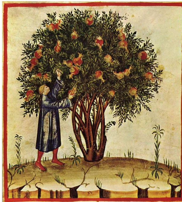
Herbarium del s.XV. Bibliot. Casanatense, Roma