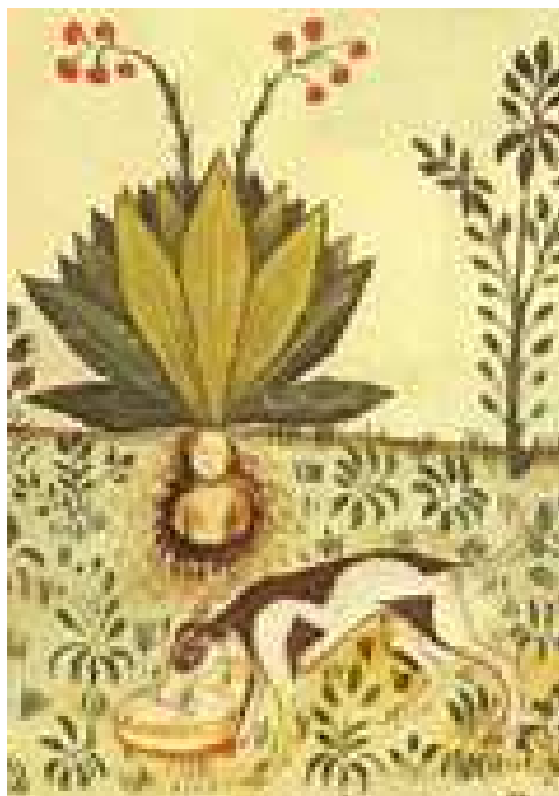
La Mandrágora, Tacuinum Sanitatis, s.XV

4 libras de Zarzaparrilla , 58 rs. 25 libras de Sal Catártica , 25 rs. 1 libra Antimonio Crudo , 48 rs. 12 libras Albayalde en Pilón , 63 rs. 14 onzas de Cardenillo Fino , 17 rs. 12 onzas Carín de Tabla , 22 rs. 3 onzas de Verde Destilado , 9 rs. 3 onzas de Azul de Prusia , 9 rs. 2 libras 8 onzas, Sombra de Venecia , 17 rs. 5 libras de Negro de Marfil , 50 rs. 6 libras de Goma del País , 300 rs. 6 libras de Quina Calisaya , 96 rs. 8 onzas Sándalo Cetrino , 18 rs. 12 onzas, Sándalo Rubio , 4 rs. 3 libras, Cuatro Cristales , 2 rs. 36 libras Quina Catinga Superior , 720 rs. 100 libras Incienso Ordinario , 100 rs. 78 libras Abeja Marina , 234 rs. 68 libras Centaurea , 68 rs, 75 libras Sanguinaria Menor , 38 rs, 90 libras Flor de Saúco , 65 rs. 79 libras Regaliz , 13 rs. 1 libra 8 onzas Hojas de Sen , 13 rs. 79 libras Raíz de Altea , 75 rs.