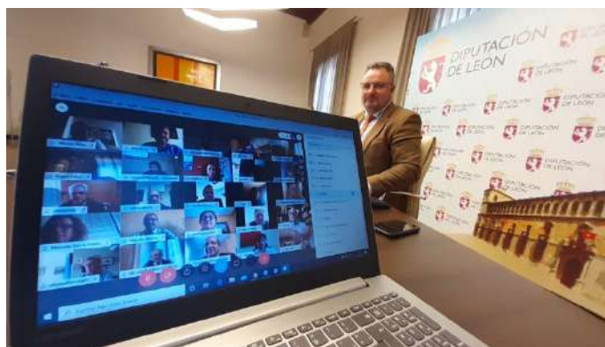
AYUDAS EXTRAORDINARIAS CONTRA LA COVID

El año también estuvo marcado por los buenos resultados de Castilla y León en informes internacionales. Sigue a la cabeza de España y en los primeros puestos de Europa.