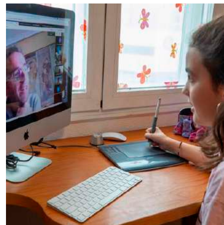
EL SISTEMA EDUCATIVO, A PRUEBA

El nuevo convenio establece las líneas generales de cooperación económica, desarrollo competencial y colaboración institucional y su vigencia es de cuatro años. Se estructura en cuatro apartados: financiación de gastos, inversiones generales, inversiones sectoriales y desarrollo competencial y colaboración institucional. Contiene importantes novedades en relación al incremento de la aportación, el desarrollo competencial y una mayor colaboración institucional