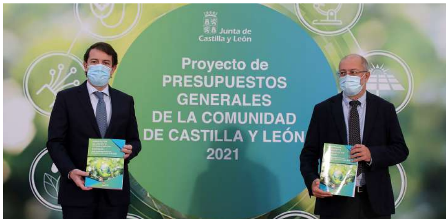
LA SANGRÍA DEL COVID-19