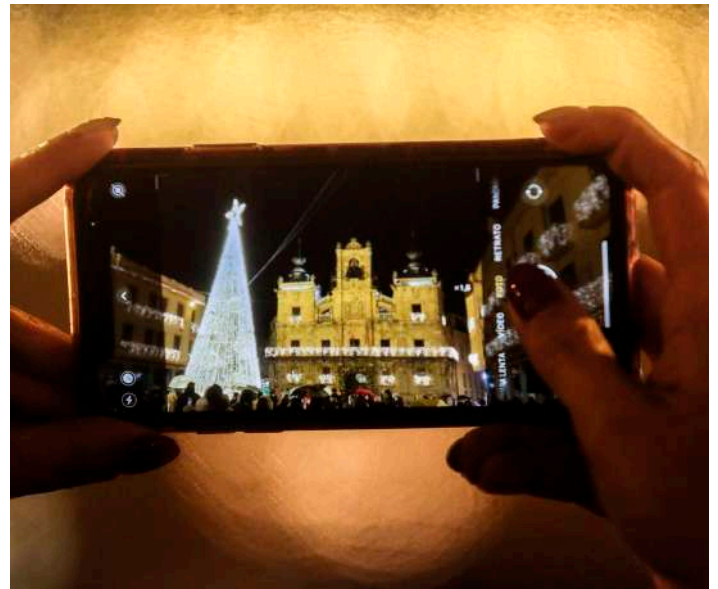
C. Sánchez / Ical