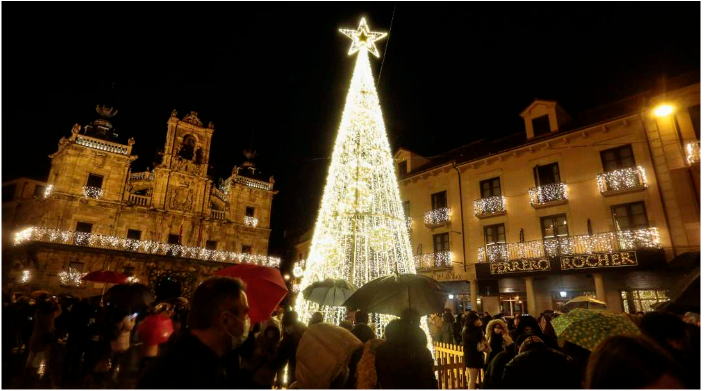
C. Sánchez / Ical