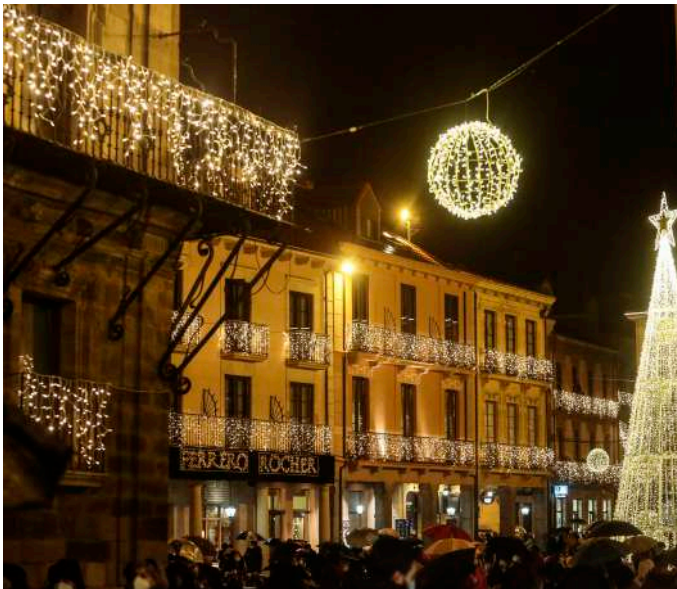
C. Sánchez / Ical