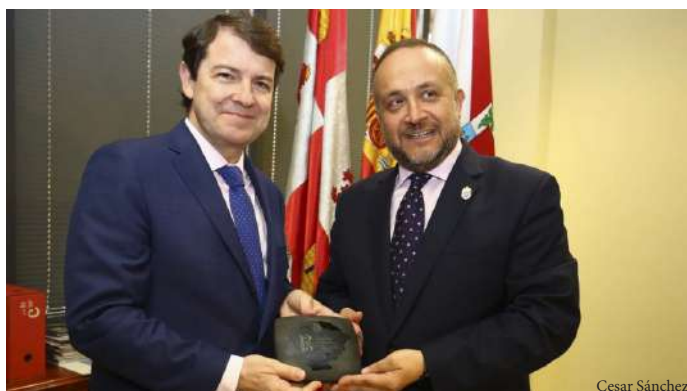
MÁS COMPETENCIAS PARA EL BIERZO

En lo positivo, destaca el primer presupuesto de Alfonso Fernández Mañueco, que alcanza una cifra récord, aunque habrá que reducir déficit los próximos ejercicios. También la oferta pública con más empleo. Además, el vicepresidente Francisco Igea prepara avances en transparencia y reorienta la política demográfica.