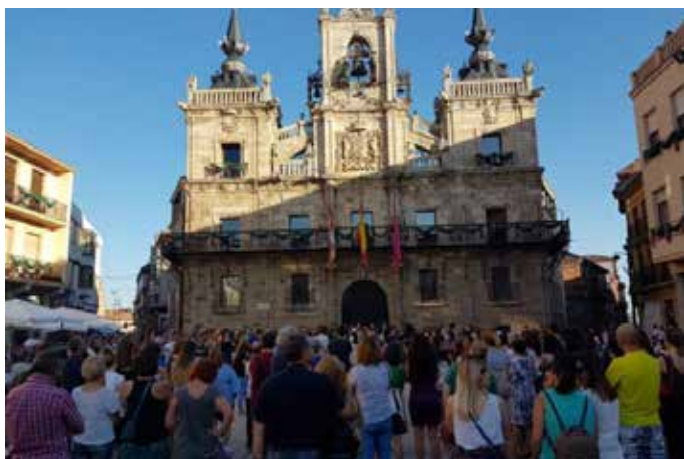
Imagen de la concentración de repulsa.

El Ayuntamiento de Astorga declaró dos días de luto oficial, al tiempo que se guardó un minuto de silencio en el Salón de Plenos de la Casa Consistorial, al que asistieron diversos representantes públicos, se suspendieron los actos institucionales y se bajaron las banderas a media asta.