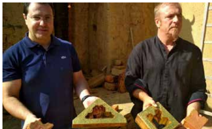
Presentación de los ladrillos en el horno de de Jiménez Jamuz.

El Palacio episcopal de Astorga conserva 18 de los moldes originales de los ladrillos que el arquitecto catalán, Antonio Gaudí, utilizó para la construcción del monumento. A través del convenio con el ayuntamiento de Santa Elena de Jamuz, Astorga cedió dos réplicas exactas al Museo-Alfar de Jiménez de Jamuz para recrear, en edición limitada, doscientos ejemplares “únicos” en el mundo.