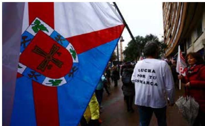
Bercianos de toda clase y condición salieron a la calle. / César Sánchez.