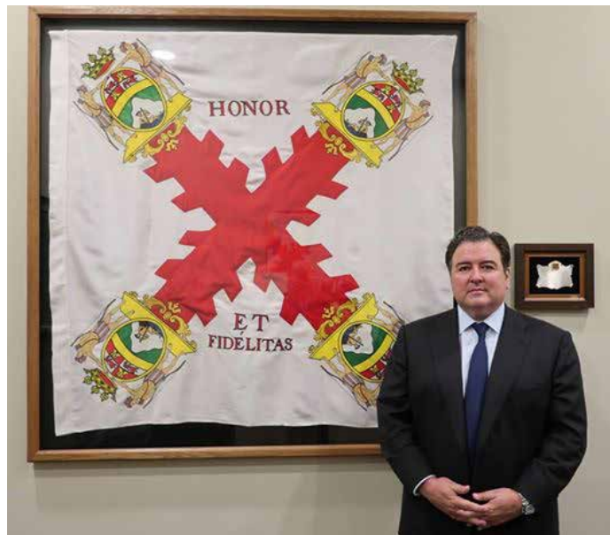
El embajador de Estados Unidos junto a la bandera del Regimiento de Luisiana.

Astorga estrechó lazos en junio con Estados Unidos, a través de la historia en común que comparten ambos pueblos. En 1780, la ciudad recibía la discreta visita del norteamericano John Adams, en aquel momento embajador de los recién independizados Estados Unidos, y que con posterioridad sucedería a George Washington como segundo presidente de su país.