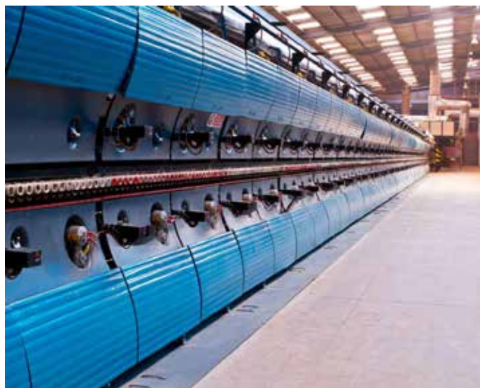
Hornos de cerámica similares a los que tendrá la fábrica de Laciana.

En 2018 Laciana asistía al nacimiento de dos importantes proyectos que devolvieron a la comarca un poco del ánimo y la confianza perdida. Ese aliento llegaba de la mano de dos proyectos que buscan la reconversión del Valle de Laciana a través de sectores muy alejados del carbón: una fábrica de cerámica y una cervecera con marca propia, la 12.70. Dos iniciativas que ya caminan hacia adelante.