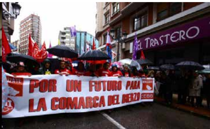
Pancarta encabezando la manifestación.