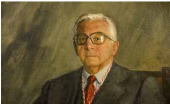
Cuadro de Celso López Gavela durante su etapa de alcalde. / Quinito.

El 9 de marzo de 2018 fallecía, a los 92 años, el primer alcalde de la democracia, el socialista Celso López Gavela, que gobernó la ciudad de Ponferrada durante 16 años.