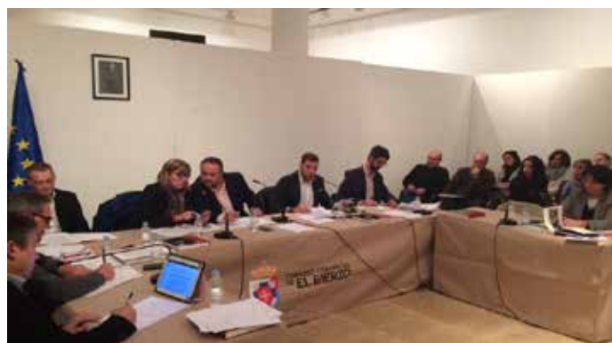
Pleno del Consejo Comarcal del Bierzo.

Sobre el personal de las empresas auxiliares, Endesa ha manifestado que se prevé que participen en el desmantelamiento, que obligará a ampliar en entre 130 y 140 personas el personal para dedicarlo a estas tareas, con puntas de hasta 200 personas en algunas fases.