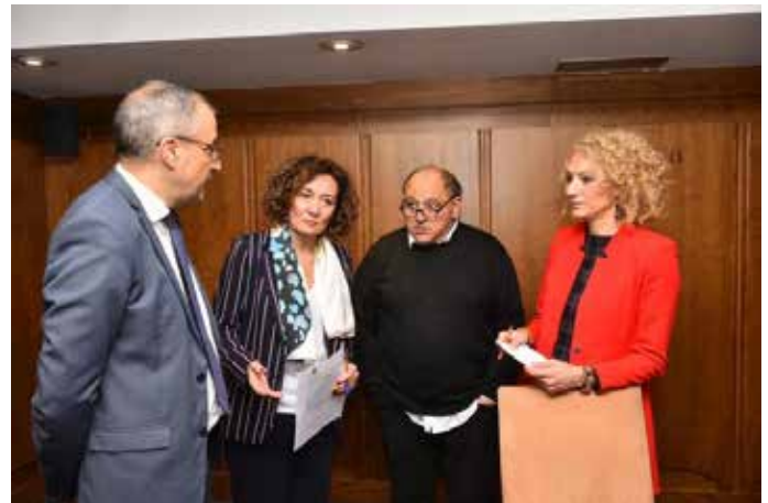
Los portavoces de PSOE, PeC y Ciudadanos durante el pleno.