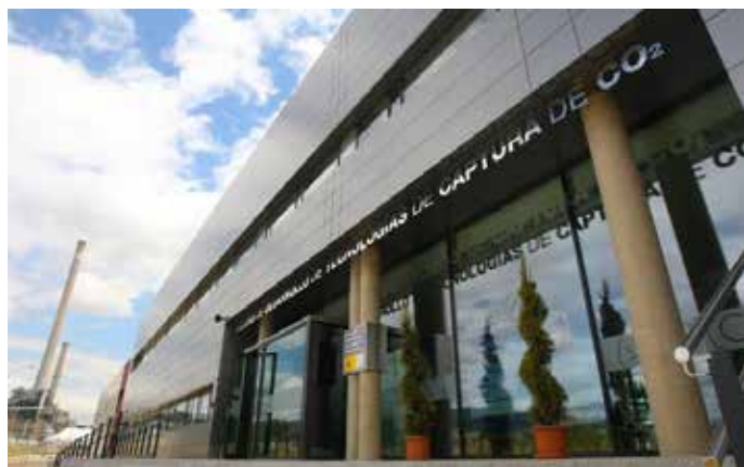
Planta de Desarrollo de Tecnologías y actual sede de Ciuden, en Cubillos del Sil.

En la misma línea, el secretario de Estado recaló la importancia de colaborar con las distintas administraciones municipales, provinciales y autonómicas para impulsar este proceso de “transformación económica, social y de empleo” del territorio. La Fundación también continuará impulsando las actividades formativas y de restauración ambiental en los espacios degradados por la actividad minera, que cobrarán incluso mayor importancia, además de continuar colaborando, como en la última etapa, con el Instituto para la Diversificación y el Ahorro Energético (Idae) -cuyo director, Joan Herrera, estuvo presente en el acto-, que será uno de los nexos del proyecto con el Gobierno central.