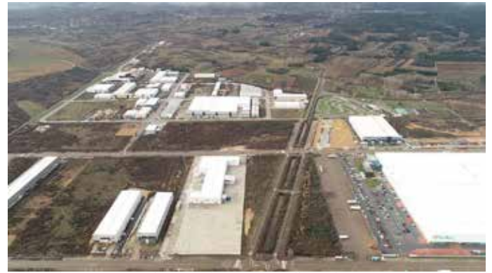
Las ayudas Miner 2017 destinan al Bierzo 2,9 millones de euros para 18 proyectos empresariales que crearán 116 empleos.

Además de estos proyectos se crearán otros 61 empleos en pequeñas empresas o negocios gracias a los fondos Miner, que elevarán el número de empleos hasta los 116.