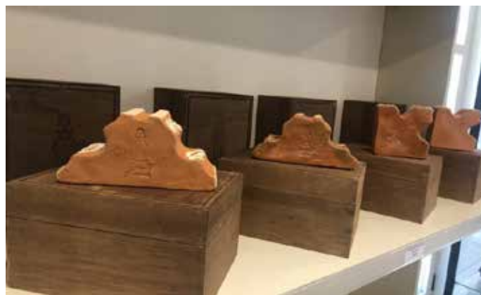
Imagen de la edición limitada de los ladrillos.

Las piezas han sido realizadas siguiendo todos los pasos tradicionales, desde la extracción del barro en los barreros del pueblo hasta la cocción con urces en el horno árabe, pasando por la decoración, ladrillo a ladrillo, con pintos y el vidriado.