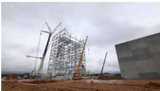
Imagen de las obras de la planta de Forestalia. / Quinito.

En el proyecto participan como accionistas Forestalia, que afronta el 83% de los fondos propios previstos en la planta de El Bierzo. El 17% restante está financiado por Somacyl y el instituto financiero Sodical.