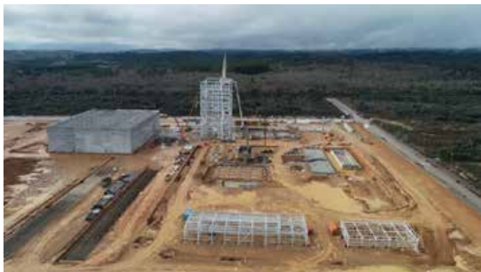
Planta de Forestalia en el polígono del Bayo, en el término de Cubillos.

El Boletín Oficial de Castilla y León publicaba en julio la resolución de la Consejería de Economía y Hacienda de la Junta de Castilla y León por la que se otorgaba autorización administrativa a la construcción de la planta de generación de electricidad a partir de biomasa en Cubillos del Sil, en el polígono industrial del Bayo.