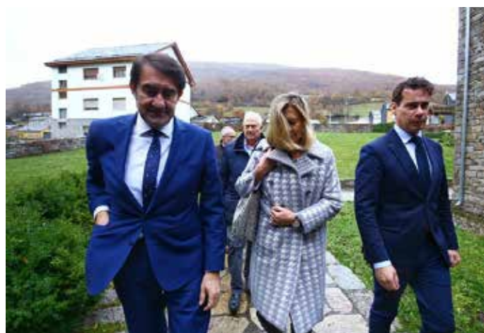
Los consejeros de Fomento y Economía, junto al alcalde de Villablino durante su última visita al municipio. / César Sánchez.

El plan, que tendrá una inversión prevista de 2,2 millones de euros, plantea que las visitas puedan realizarse por grupos, con un máximo de veinte personas de cualquier edad. Con un recorrido guiado e interpretado de aproximadamente dos horas, el turista que se acerque a este centro minero podrá tener una visión global de lo que era una clásica explotación de carbón en la comarca de Laciana.