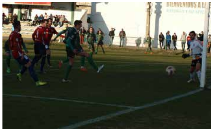
Imagen del encuentro entre el Atlético Astorga y el Real Ávila.

Entre las novedades, además de cambiar el blanco por dorado y oscurecer un poco el característico verde, van impresos los nombres de jugadores, entrenadores y presidentes que han pasado por el club en los últimos 50 años. El equipo astorgano presentó ante decenas de aficionados y autoridades la nueva equipación diseñada por José Luis de la Iglesia y que ha ejecutado Kappa.