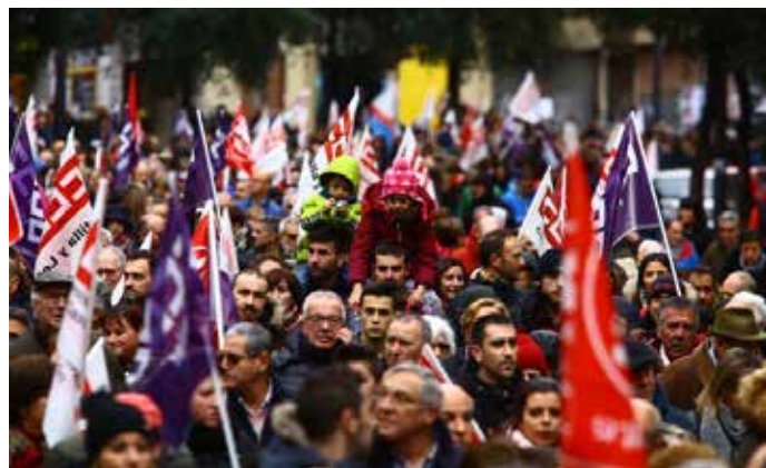
Manifestación por el futuro del Bierzo.

Salvo contadas excepciones, todos los agentes sociales del