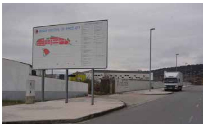
Polígono Industrial de Bembibre. / Quinito.

Tras la aprobación del proyecto en la comisión de Cooperación entre el Instituto para la Reestructuración de la Minería del Carbón y Desarrollo Alternativo de las comarcas Mineras y la Junta de Castilla y León, se abrió un plazo de tres meses para aportar el proyecto y la documentación necesaria para tramitar el convenio específico de colaboración que permita la ejecución definitiva del proyecto.