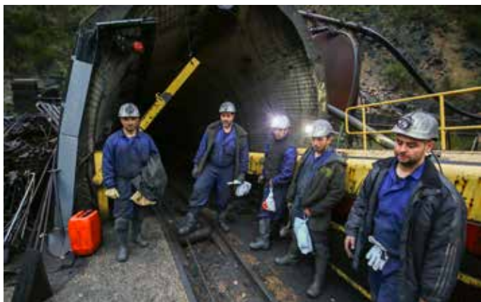
Míneros a la puerta del pozo Salgueiro, el día del cierre.