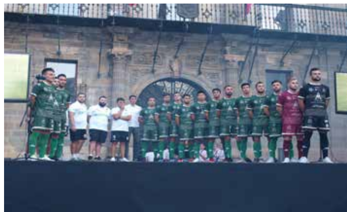
Presentación Atlético Astorga 2018/2019. / Ana Junquera.

El Atlético Astorga FC presentó en el mes de agosto la nueva equipación del equipo para la temporada 2018/19.