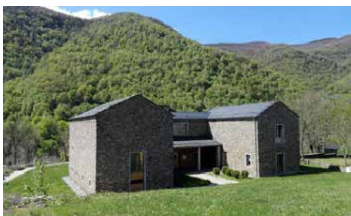
Centro del Urogallo donde se construirá el voladero.

Sin duda una de las buenas nuevas más importantes que trajo consigo el año 2018 fue el anuncio para la comarca de Laciana de una inversión de 2,9 millones con cargo al Programa de Infraestructuras Turísticas en Áreas Naturales de Castilla y León. Era finales del mes de septiembre cuando los consejeros de Fomento y Medio Ambiente, Juan Carlos Suárez-Quiñones, y de Economía y Hacienda, Pilar del Olmo, visitaban el municipio de Villablino y anunciaban cuatro actuaciones muy esperadas en la comarca, todas ellas encaminadas a potenciar el turismo del Valle: 'la mina en vivo', la creación de un voladero de urogallo junto a un edificio polifuncional y la reforma del albergue de Caboalles de Arriba.