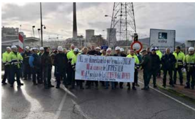
Protesta de los trabajadores de las empresas auxiliares de la central de Compostilla.

Sin embargo, a la puerta del ministerio se concentraban varias decenas de trabajadores de contratas y empresas auxiliares del sector para protestar contra los términos del acuerdo que les deja fuera y que a día de hoy prosiguen su lucha por formar parte de él.