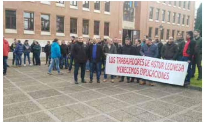
Protesta de los trabajadores de la Astur Leonesa.

Este nuevo Plan del Carbón contempla una inyección de 250 millones de euros, repartidos en cinco años, para apoyar iniciativas empresariales y de desarrollo de las comarcas mineras, además de prejubilaciones y bajas incentivadas. Sin embargo, el acuerdo marco deja fuera a los trabajadores de las auxiliares.