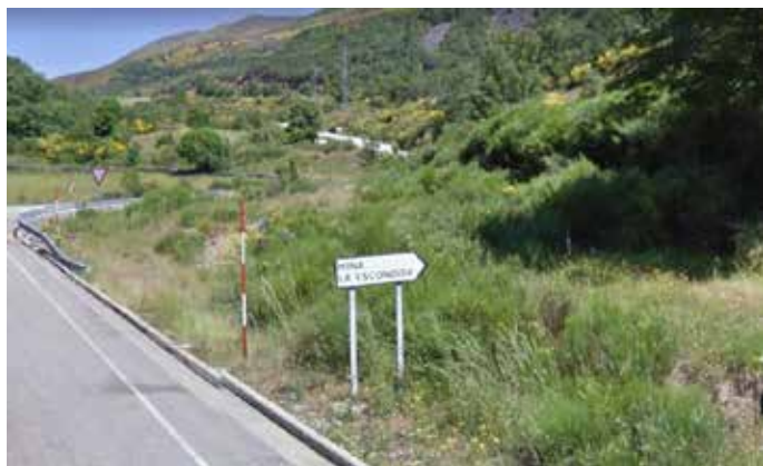
Proximidades de la mina La Escondida.