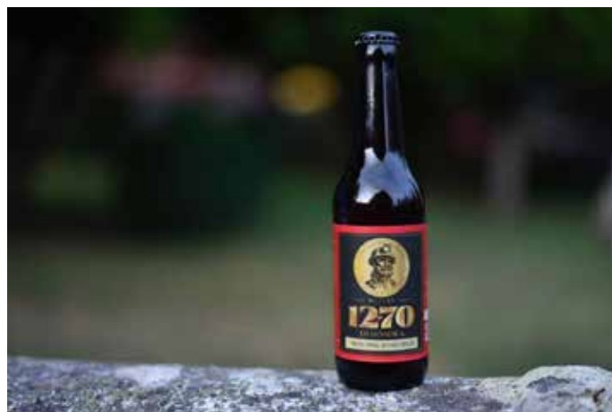
La primera tirada de la 12.70, limitada, se hizo coincidir con San Roque.