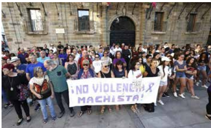
La sociedad astorgana se concentró en repulsa al crimen.

El martes 23 de julio Astorga se despertaba con la noticia más trágica del año, un caso de violencia de género que sacó a la ciudadanía a la calle para mostrar su repulsa y recordar a la víctima.