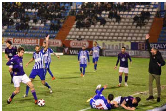
Imagen del partido de la Ponferradina contra el Celta B.