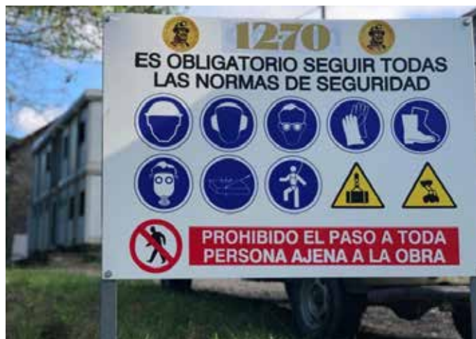
Entrada al grupo Lumanjo.

Con estos dos proyectos, y otros tantos que bien seguro vendrán a lo largo del 2019, la comarca se prepara para recibir con los brazos abiertos otros modelos de economía. Porque en época de crisis es necesario reinventarse. Y es ahora o nunca.