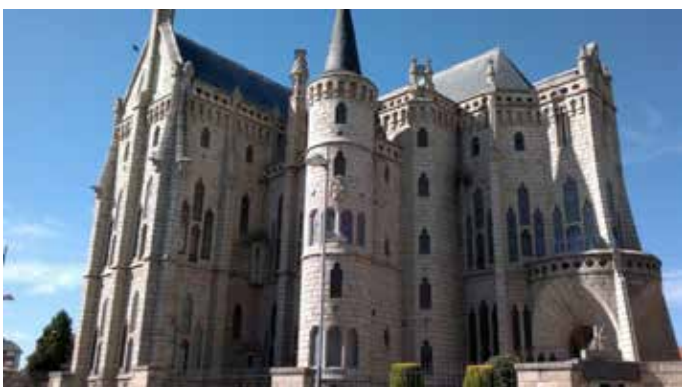
Palacio Episcopal de Astorga, obra de Antonio Gaudí.

Exposiciones, música, talleres infantiles, demostraciones y religiosidad en torno a la figura del emblemático arquitecto ayudaron a la divulgación de su obra entre los astorganos y el público en general.