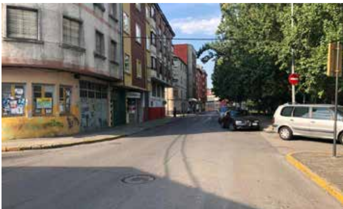
Imagen de la Puebla Norte.

La rehabilitación de las viviendas se centrará en las reparaciones de la estructura en mal estado, su impermeabilización y aislamiento, tanto de fachadas como de cubiertas, instalación de ascensores, sistemas de calefacción y refrigeración de alta eficiencia y de ahorro energético en elementos comunes. El ARU también mejorará la ordenación viaria de la circulación rodada creando diferentes áreas ambientales, restricción del tráfico interior, renovación de la red de abastecimiento de agua y de saneamiento, soterramiento de las instalaciones eléctricas y de comunicaciones que transcurren por fachadas y sustitución de luminarias por tecnología LED.