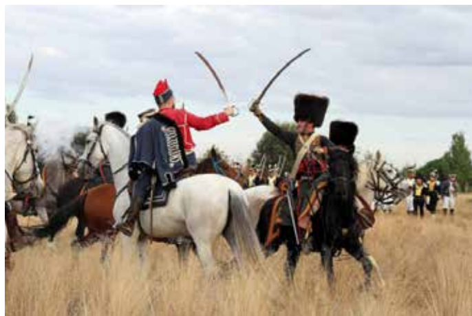
Recreación histórica de los primeros enfrentamientos entre el ejército francés y los aliados a las afueras de Astorga.

Recreadores de quince países acudieron en octubre a Astorga para participar en la mayor recreación napoleónica de Europa en 2018. La ciudad conmemoró durante tres días '3Naciones', que recordó los últimos días de 1808 y los primeros de 1809, cuando la localidad maragata fue el centro de la historia de las Guerras Napoleónicas. Astorga y sus alrededores dieron, a principios del siglo XIX, cobijo al ejército inglés y español. Desde allí ambos planificaron la retirada – uno por el puerto de Manzanal y el otro por Foncebadón – mientras hacía su entrada en la ciudad el propio Napoleón Bonaparte a la cabeza del ejército francés.